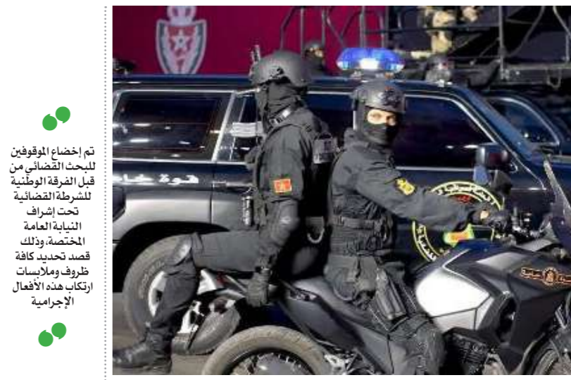
تم إخضاع الموقوفين للبحث القضائي من قبل الفرقة الوطنية للشرطة القضائية تحت إشراف النيابة العامة المختصة، وذلك قصد تحديد كافة ظروف وملابسات ارتكاب هذه الأفعال الإجرامية

فيه الأول الذي تم ضبطه يوم أمس الجمعة ، وذلك للاشتباه في مشاركتها في ارتكاب هذه الأفعال الإجرامية. وكانت مصالح الأمن الوطني قد تفاعلت، بجديّة، مع تسجيل الفيديو الذي أظهر تحريض المشتبه فيهم لطفل قاصر على استهلاك مواد كحولية، حيث تم توقيف المشتبه فيه الأول يوم أمس الجمعة، قبل أن يتم لاحقاً ضبط شقيقه بدوار "الخصاصمة مالين الواد" بالقرب من مدينة بنسليمان، وذلك بتنسيق ميداني مع عناصر الدرك الملكي المختصة ترابياً. يذكر أن الموقوفون الثلاثة هم أشقاء كانوا قد ظهروا في تسجيل فيديو تم تداوله بشكل واسع عبر شبكات التواصل الاجتماعي، وهم بصد تحريض ابن شقيقهم القاصر البالغ من العمر 06 سنوات على استهلاك مشروب كحولي، قبل أن يتم تحديد هوياتهم ويتم توقيفهم. وقد تم إخضاع الموقوفين للبحث القضائي من قبل الفرقة الوطنية للشرطة القضائية تحت إشراف النيابة العامة المختصة، وذلك قصد تحديد كافة ظروف وملابسات ارتكاب هذه الأفعال الإجرامية.